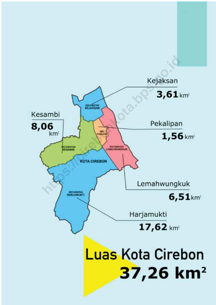
Gambar 1.1 Luas Daerah menurut Kecamatan (%), 2020 Figures 1.1 Area of Subdistrict (%), 2020