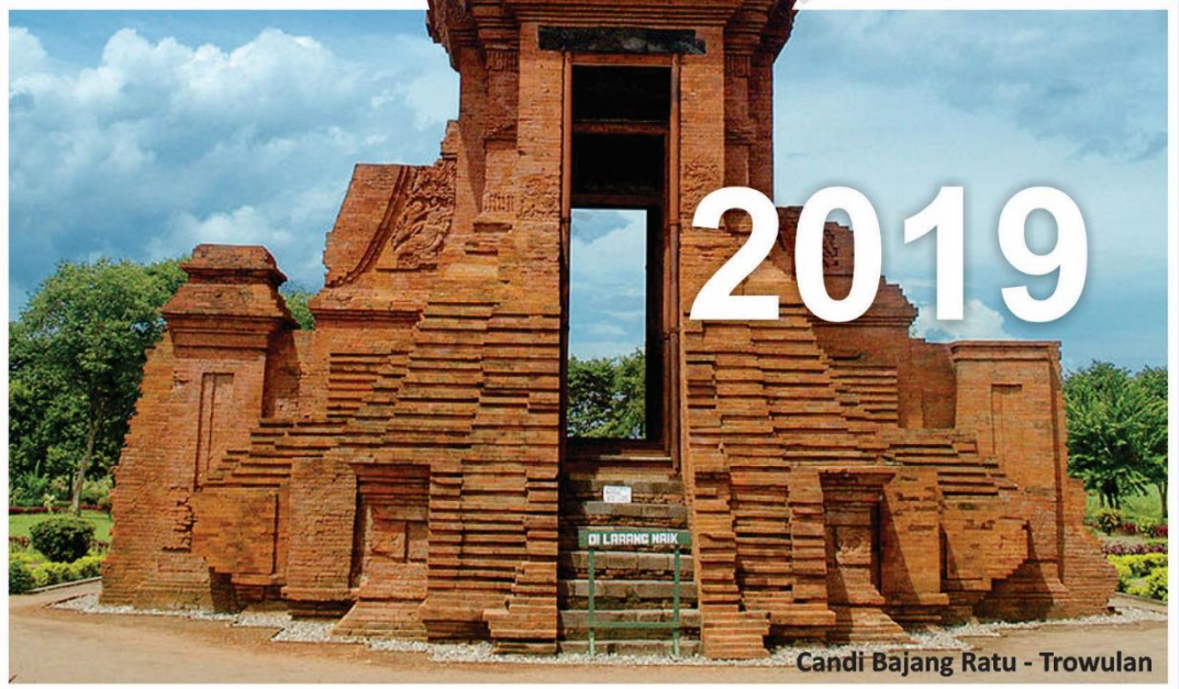
Candi Bajang Ratu - Trowulan