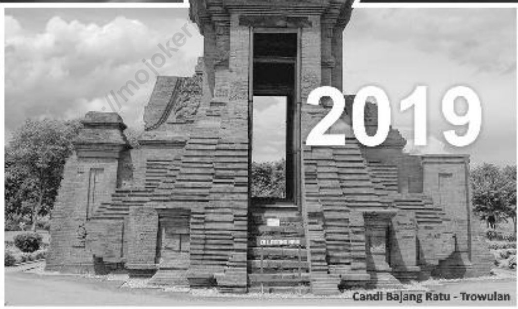
Candi Bajang Ratu - Trowulan