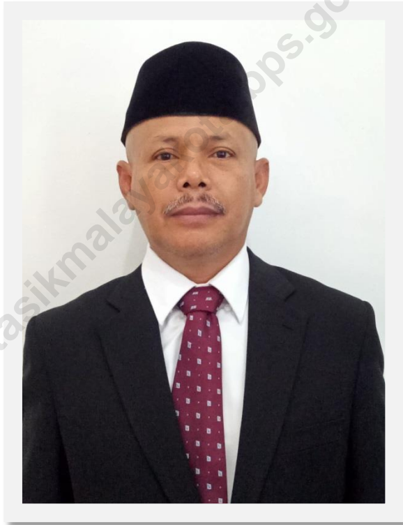
JAM JAM ZAMACHSYARI, SE